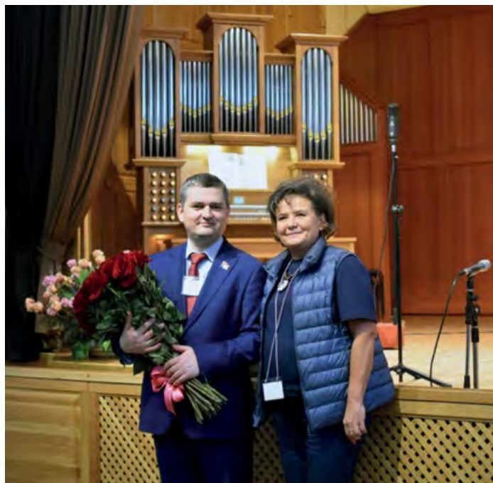
Открытие Научно-практической конференции «Бакуловские чтения – 2019» в рамках III Всероссийского конкурса юных пианистов имени А. А. Бакулова.

Мы благодарны каждому родителю за посильный вклад, который он вносит в развитие школы. При посильном участии новоуральских семей школа смогла заменить деревянные окна на пластиковые