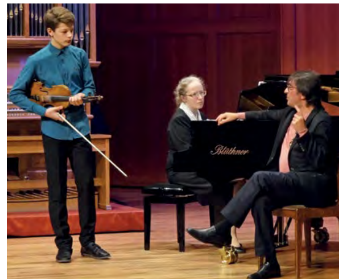
Творческая встреча – мастер-класс народного артиста СССР Юрия Башмета.

Школы искусств закрытых городов – это уникальное сообщество единомышленников. Не было интернета, взаимодействие