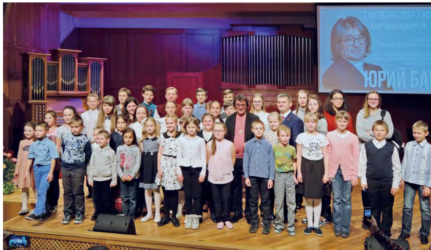
Творческая встреча с Юрием Башметом.

“ В 2019-м году ДШИ Новоуральска стала одной из 28 образовательных организаций Свердловской области, где впервые была успешно начата реализация федерального проекта «Культурная среда» национального проекта «Культура». На улучшение материально-технической базы из федерального, регионального и муниципального бюджетов было выделено 7 миллионов 227,5 тысяч рублей. В итоге, для талантливых детей Новоуральска были приобретены 25 музыкальных инструментов и 36 комплектующих к ним, 149 единиц учебного, видео и аудио оборудования, 80 интерактивных пособий.