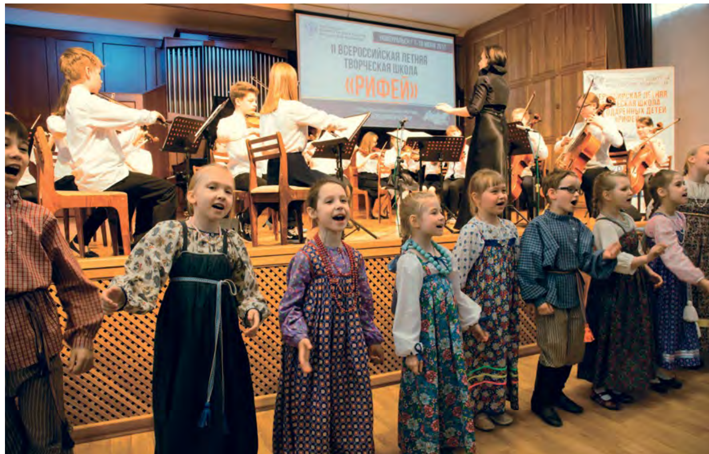
Всероссийская творческая школа для одарённых детей «Рифей» объединяет более тысячи участников из двадцати пяти регионов России.

«Новоуральский народный орган – культурная достопримечательность и символ духовного единения города. Народную инициативу Новоуральского филармонического общества и Хорового общества собрать «всем миром» средства и установить в Детской школе искусств орган поддержали более семи тысяч человек: жители городов России, депутаты, профсоюзы, российские учёные и музыканты, Госкорпорация «Росатом» и её предприятия, администрация города. В ноябре 2015-м года в Новоуральске зазвучала органная музыка, в 2016-м году был открыт класс органа для юных новоуральцев и стартовал первый органный сезон.