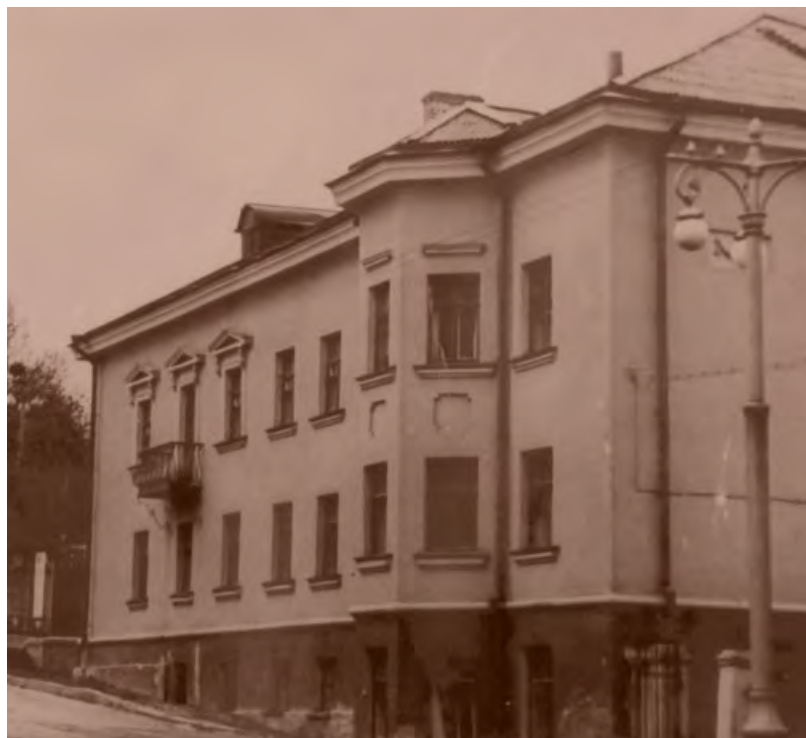
Первое здание школы на улице Крупской.

– Уникальна история нашей школы: первыми руководителями и преподавателями в далекие пятидесятые годы XX века были вы-