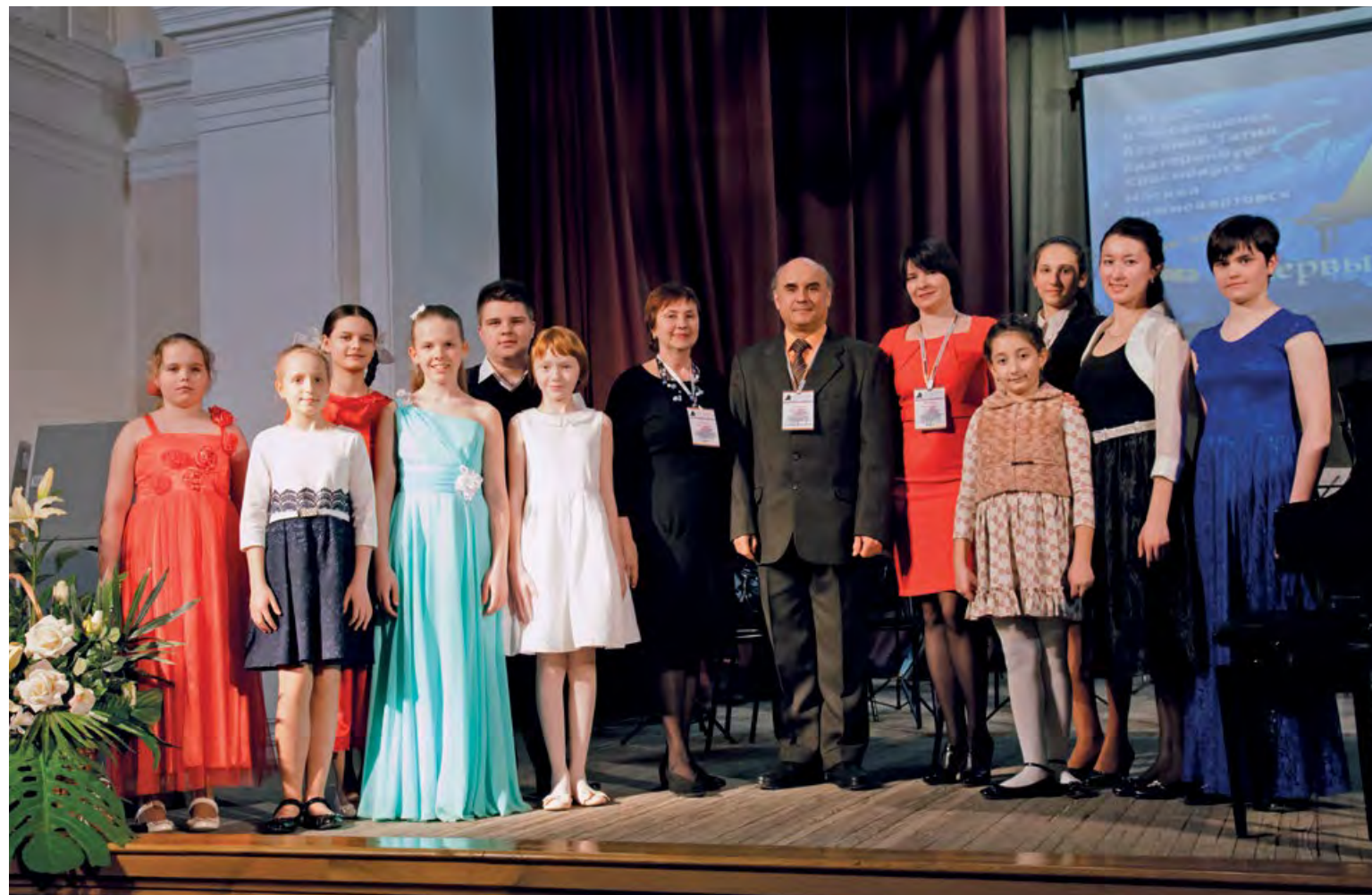
Лауреаты и члены жюри I Всероссийского конкурса юных пианистов имени А. А. Бакулова.

культуры. Поэтому все, кто приходят в Детскую школу искусств Новоуральска, начинают своё знакомство с миром искусства с групп развития для выявления интересов каждого ребёнка и предпочтений его родителей. Очень важно в самом начале пути дать верное представление о том, что образовательные программы – это комплекс учебных предметов особой направленности, имеющий пролонгированный характер. Мы настраиваем родителей наших