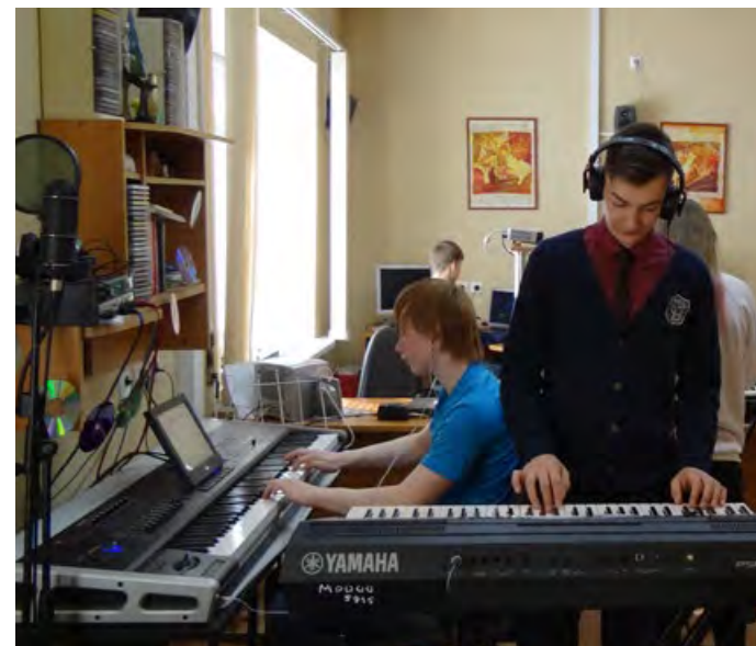
Музыкально-компьютерные технологии – творческая лаборатория для талантливой молодёжи.

стеклопакеты, поменять несколько десятков метров трубы холодного водоснабжения, сделать несколько ремонтных проектов, отремонтировать учебные помещения и места общего пользования, и, конечно, приобрести новые музыкальные инструменты. Родительская общественность школы ежегодно становится лауреатом городского проекта благодотворителей «От сердца к сердцу».