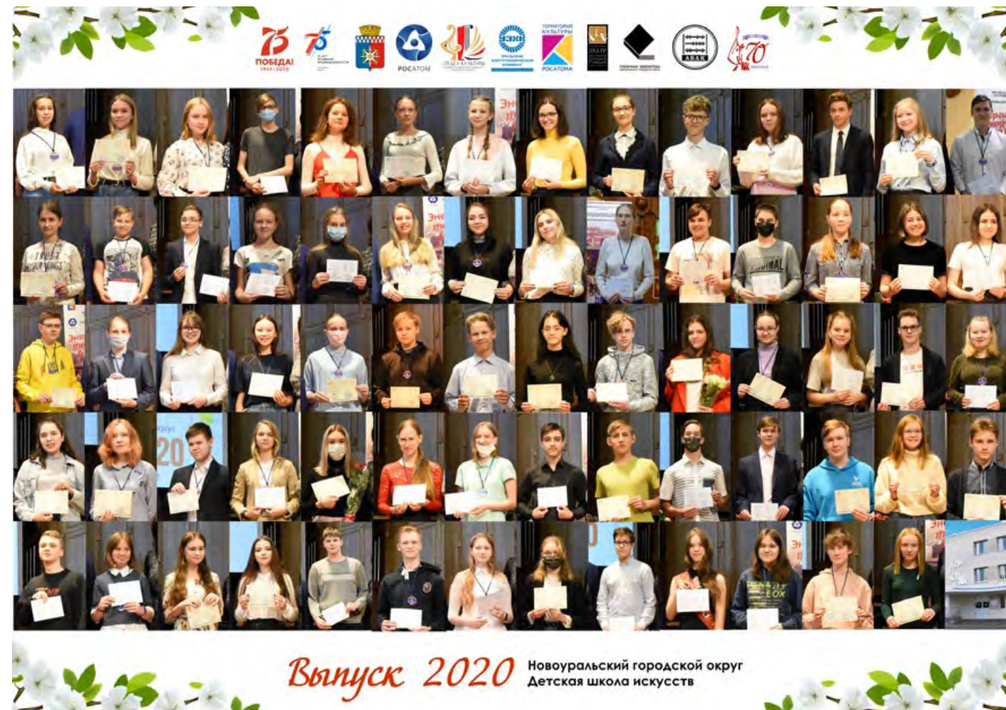
Выпускники 2020-го года с честью справились с итоговой аттестацией в условиях дистанционного обучения.

В закрытых городах учреждения дополнительного художественного образования играют важную социальную роль, формируют позитивную творческую среду и являются одними из факторов инвестиционной привлекательности территорий, выполняя функцию