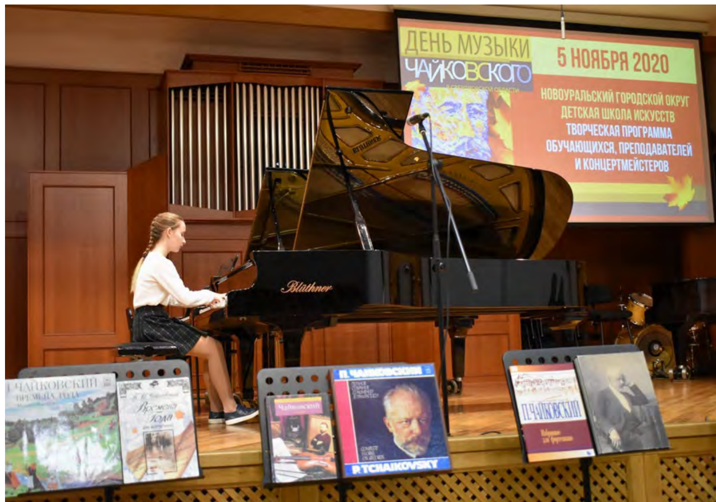
В 2020-м году музыкальная программа «Наш Чайковский» прошла в прямой трансляции на портале КУЛЬТУРА.РФ.