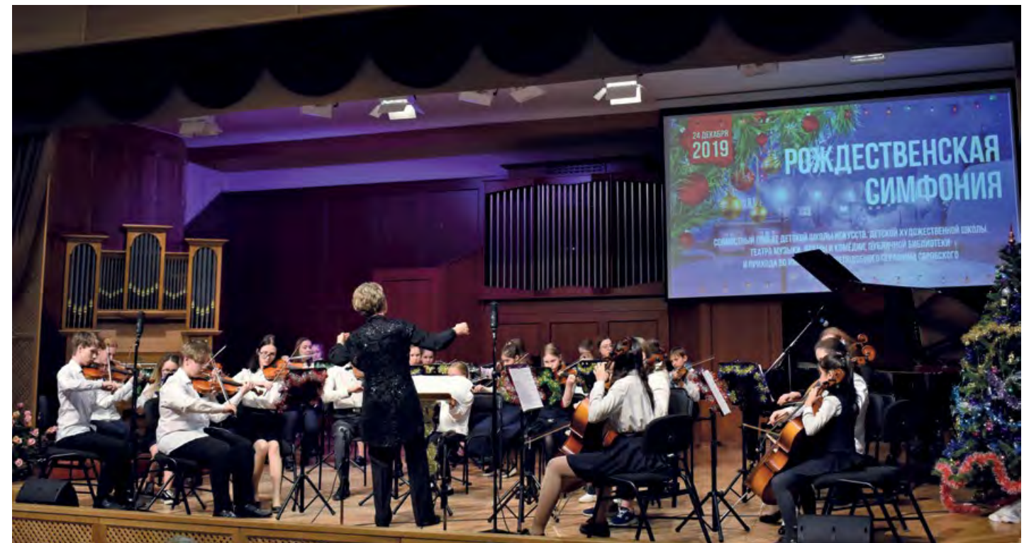
«Рождественская симфония» – многолетнее творческое содружество учреждений культуры и прихода во имя святого преподобного Серафима Саровского города Новоуральска.

Дистанционное обучение проходило в индивидуальных и групповых формах: дистанционные уроки online (разнообразные конференц-