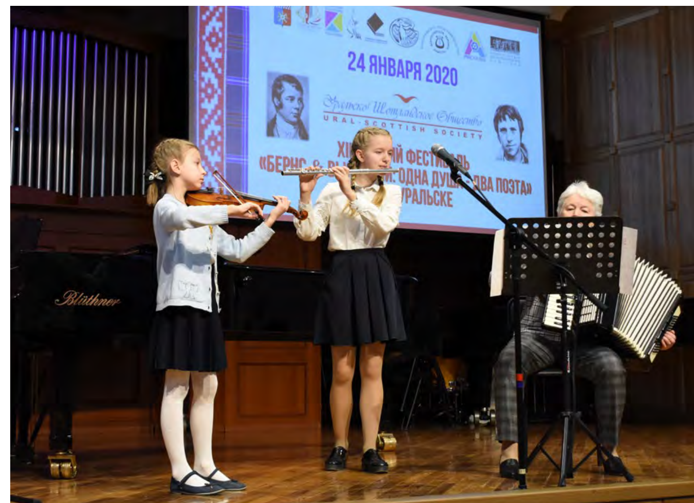
Зимний фестиваль Уральско-Шотландского общества – в диалоге культур разных народов сохраняются семейные музыкальные традиции.

“ С первых лет своего существования школа бережно сохраняла связи с Уральским электрохимическим комбинатом. С 2013-го года УЭХК оказывает грантовую поддержку образовательным и культурно-просветительским проектам, которые школа реализует для жителей города. В 2019-м году успешно стартовали новые долгосрочные проекты: «Новоуральская открытая консерватория» – цикл интерактивных лекций о музыке и искусстве, «Большие мастера – малым городам» – творческие встречи с выдающимися российскими исполнителями. Участниками проекта уже стали более шестисот школьников, ветеранов и ценителей искусства.