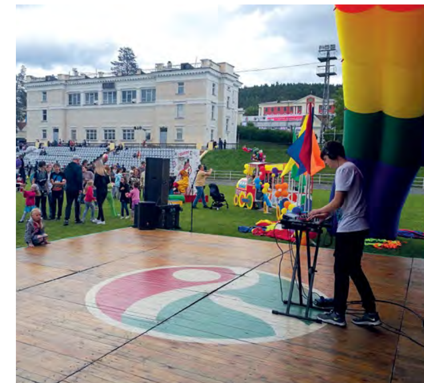
Диджеи ДШИ постигают мастерство на практике во время городских праздников.

Для преобразований в учреждении руководитель должен постоянно изучать передовой опыт и совершенствоваться