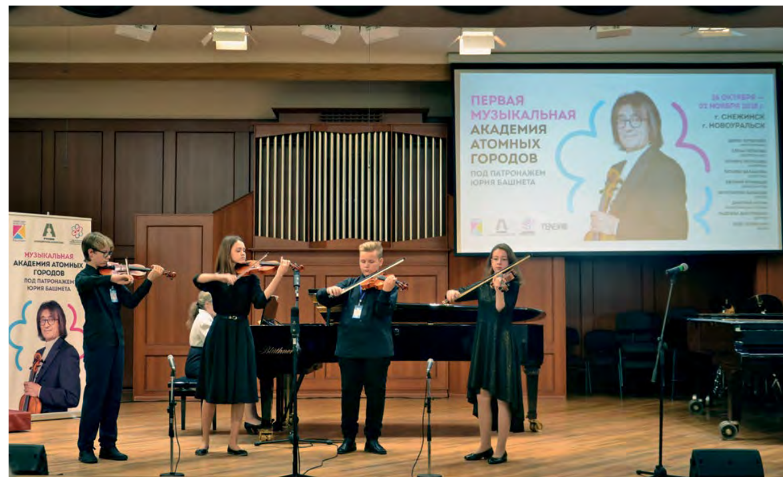
ДШИ Новоуральска – площадка Первой музыкальной академии атомных городов. Художественный руководитель, народный артист СССР Юрий Башмет.