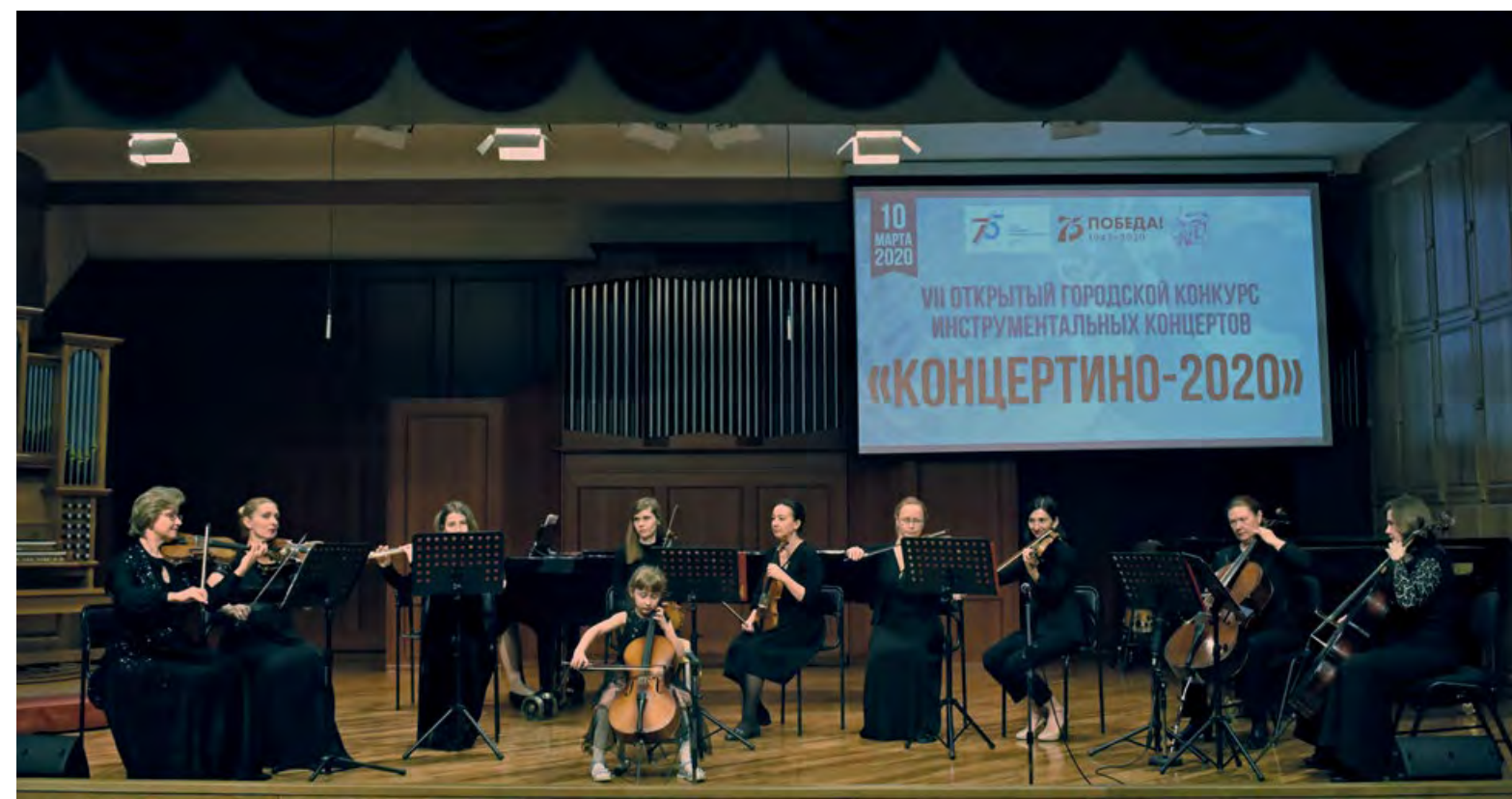
Открытый городской конкурс инструментальных концертов «Концертино» – проект творческой преемственности.

Мы гордимся успехами в реализации наших уникальных проектов «Новоуральский народный орган», «Всероссийский конкурс юных пианистов имени А. А. Бакулова», «Всероссийская летняя творческая школа для одарённых детей «Рифей». Время не стоит на месте. За рефлексией по реализованным проектам не забываем о движении к новым событиям. В 2019-м году при грантовой поддержке АО «Уральский электрохимический комбинат» школа реализовала проекты «Новоуральская открытая консерватория» и «Большие мастера – малым городам».