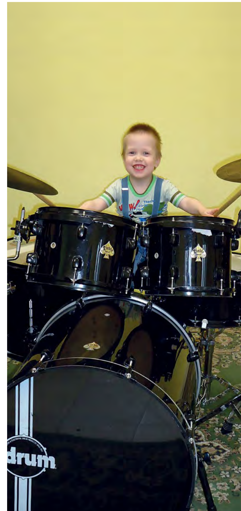
Творческое развитие с раннего детства – любимое дело на всю жизнь.

«В ДШИ обучается 976 детей, из них 580 обучающихся осваивают дополнительные предпрофессиональные общеобразовательные программы в области искусств: «Фортепиано», «Струнные инструменты», «Духовые и ударные инструменты», «Народные инструменты», «Хоровое пение», «Музыкальный фольклор», «Искусство театра», «Хореографическое творчество». 256 человек получают образование по договорам об оказании платных образовательных услуг. Обучающимся школы предоставляется возможность осваивать эксклюзивные образовательные курсы по направлениям «Музыкально-компьютерные технологии», «Диджеинг», «Орган».