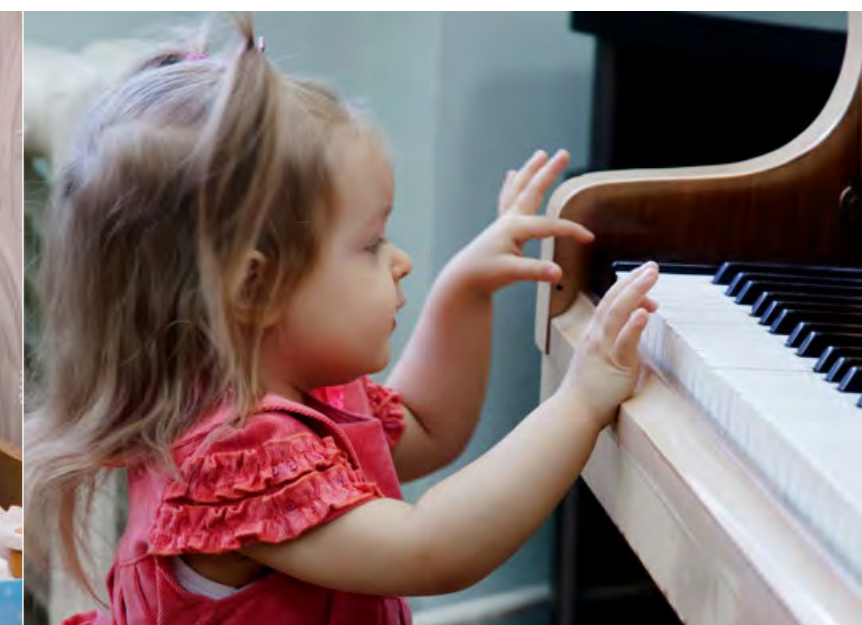
Группы эстетического развития – первая ступень творческого воспитания юных новоуральцев.

осуществлялось по почте и телефонной линии, и, тем не менее, представители педагогического сообщества обменивались методиками и работали на научных конференциях. В 1977-м году произошло знаковое событие: в Новоуральске состоялся Первый конкурс учащихся музыкальных школ городов ЗАТО. Так сложилась традиция творческих форумов учеников и преподавателей, которые и до сегодняшних дней ежегодно проходят по тем или иным образовательным направлениям.