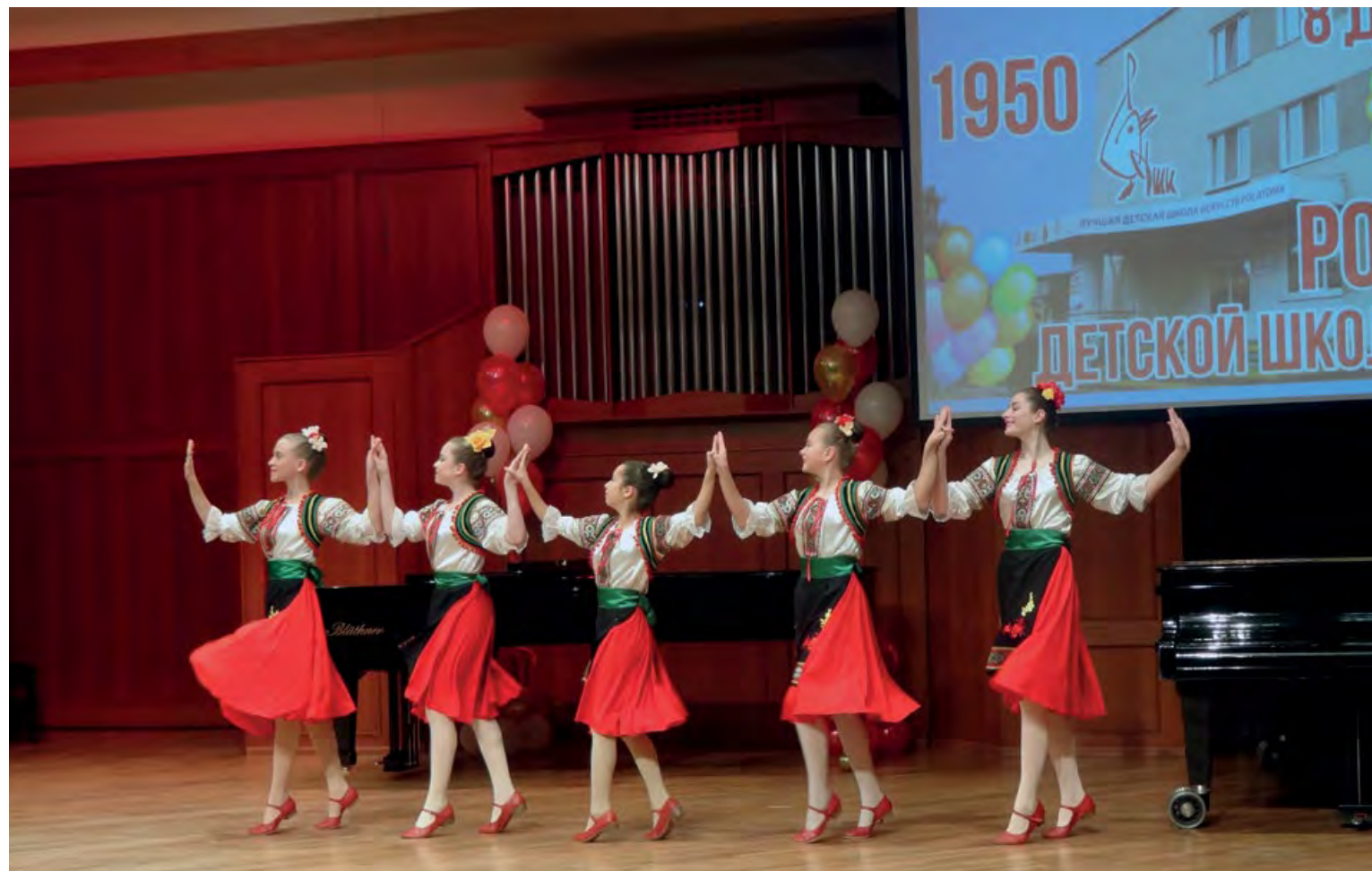
Хореографические номера – украшение праздничных концертов.