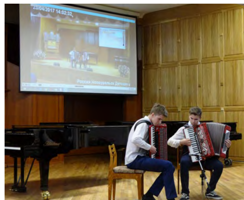
Благодаря прямым трансляциям, с 2013-го года все значимые мероприятия школы доступны каждому.

“ Детская школа искусств активно содействует развитию общественно-культурных инициатив, реализует проекты Новоуральское филармоническое общество, Новоуральское представительство Всероссийского хорового общества, Уральско-Шотландское общество, «Новоуральский народный орган». Признание педагогического сообщества получили проекты «Всероссийский конкурс юных пианистов имени А. А. Бакулова», «Всероссийская летняя творческая школа для одаренных детей «Рифей», Всероссийская научно-методическая ассамблея «Школа искусств в образовательном и культурном пространстве малого города»