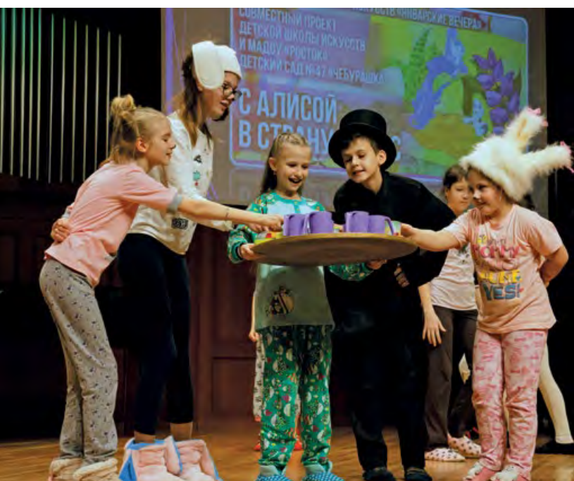
Обучающиеся программы «Искусство театра» – участники Детского фестиваля искусств «Январские вечера».

сертации по теме: «Управление культурно-образовательными учреждениями закрытых территориально-административных образований (на примере Новоуральска)». Умение заглядывать в будущее – обязательная компетенция современного руководителя, а знания дают возможность реализовывать проекты нового типа и позволяют школе быть центром реализации инновационных проектов в сфере культуры.