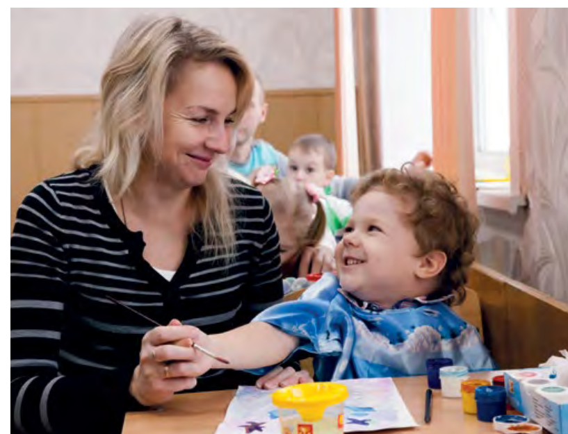
Совместное творчество – путь к взаимопониманию детей и родителей.